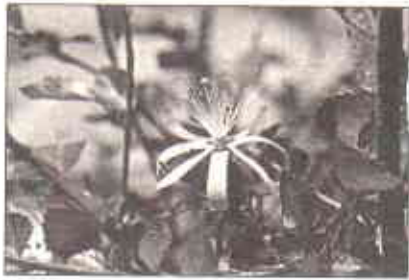
جالیسروے کے مطابق پارک میں انواع کی دوسو سے زیادہ

جب ایس ڈبلیو ڈی نے آئی یو سی این سے رابطہ قائم کیا تو ماحولیاتی گروپوں نے بھی برابر کا ساتھ دیا۔ آئی یو سی این پاکستان نے اپنی پاکستان نیشنل کونسل ممبر شپ کے اندر کیرتھر پر ایک ذیلی کمیٹی تشکیل دی۔ پھر اس ذیلی کمیٹی کو سٹیٹس کمیٹی برائے کیرتھر بنانے