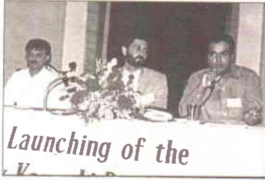
Launching of the