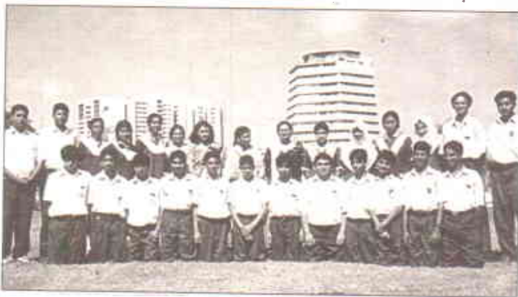
شہری یوتھ ٹیم کے اراکین